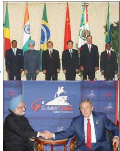
ପିତୃପୁତ୍ରରେ ପ୍ରଧାନମନ୍ତ୍ରୀ ମନମୋହନ ସିଂହଙ୍କ ଜି-୮ ବୈଠକରେ ସ୍ୱତନ୍ତ୍ର ସଦସ୍ୟଭାବେ ଯୋଗ ଦାନ ଏବଂ ବୁଣ୍ଟଙ୍କ ସହ ଆଲୋଚନାର ସୁଦୂରପ୍ରସାରୀ ପ୍ରଭାବ ରହିଛି ।